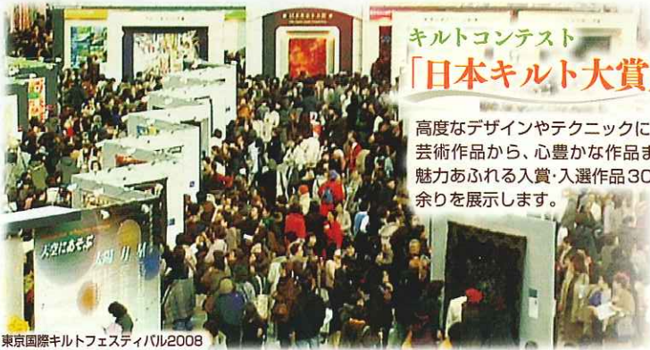
東京国際キルトフェスティバル2008

「森」に生きる動物、植物、鳥や虫。木々をわたる風や、水、光・・・ 第一線のキルト作家が、キルトに描く「森」の世界です